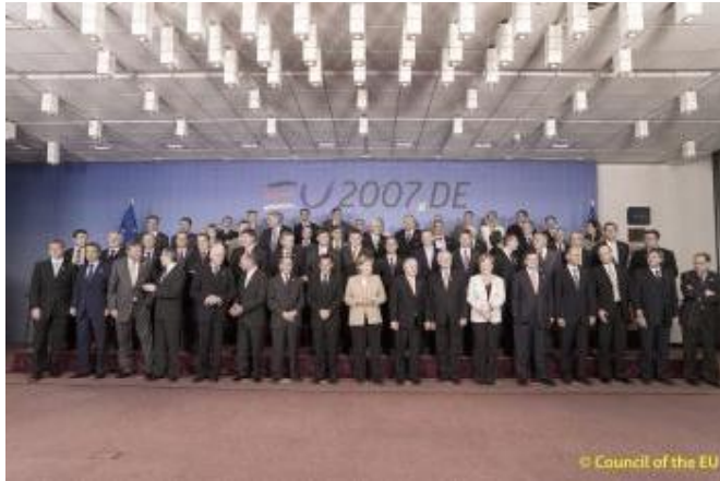
European Council, family photo

Der Präsident des Europäischen Parlaments, Hans-Gert Pöttering, hat das Ergebnis des EU-Gipfeltreffens als wichtigen Schritt zur notwendigen Reform der Europäischen Union begrüßt. Es sei nach schweren Verhandlungen gelungen, eine Einigung zu erreichen und damit eine Krise in der Europäischen Union zu vermeiden. Er sprach der Präsidentin des Europäischen Rates, Bundeskanzlerin Angela Merkel, ohne die diese Einigung nicht möglich gewesen wäre, seinen Dank aus.