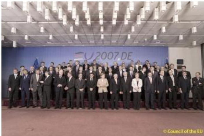
European Council, family photo

Der Pr?sident des Europ?ischen Parlaments, Hans-Gert P?ttering, hat das Ergebnis des EU-Gipfeltreffens als wichtigen Schritt zur notwendigen Reform der Europ?ischen Union begr??t. Es sei nach schweren Verhandlungen gelungen, eine Einigung zu erreichen und damit eine Krise in der Europ?ischen Union zu vermeiden. Er sprach der Pr?sidentin des Europ?ischen Rates, Bundeskanzlerin Angela Merkel, ohne die diese Einigung nicht m?glich gewesen w?re, seinen Dank aus.