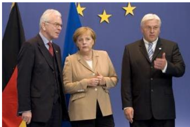
President Pöttering greeted by Chancellor Merkel and Minister Steinmeier in the Council

Als positive politische Erfahrung der letzten Monate wertete Hans-Gert Pöttering, dass die Ratspräsidentschaft, das Europäische Parlament und die Europäische Kommission für die gleichen Ziele in hervorragender Weise zusammengearbeitet haben, um ein positives Ergebnis zu erreichen.