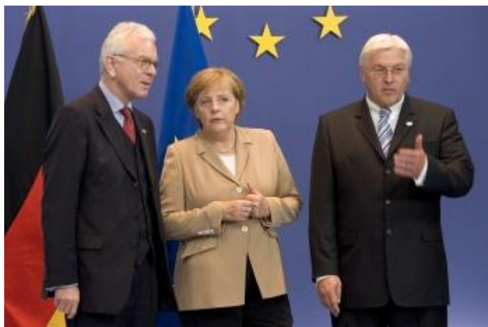
President P?ttering greeted by Chancellor Merkel and Minister Steinmeier in the Council

Als positive politische Erfahrung der letzten Monate wertete Hans-Gert P?ttering, dass die Ratspr?sidentschaft, das Europ?ische Parlament und die Europ?ische Kommission f?r die gleichen Ziele in hervorragender Weise zusammengearbeitet haben, um ein positives Ergebnis zu erreichen.